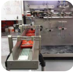
CINTA DE ALIMENTACIÓN

Somos expertos en aplicaciones "retort", en las que los envases se transfieren a un proceso de autoclave, ofreciendo las mayores garantías de integridad de las soldaduras.